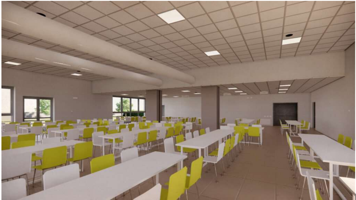
render della nuova mensa

Un appuntamento desiderato e atteso dalla Comunità di Sona che andrà a completare l'opera del Polo scolastico "Silvio Pellico" iniziata nel 2017, ospitando anche il biennio della primaria, ovvero 8 classi per un totale di 200 alunni e 1950 mq destinati ad aule e spazi per le attività integrative, oltre ad una mensa di circa 350 mq con cucina attrezzata per la cottura degli alimenti e la possibilità di ospitare un doppio turno di refezione a servizio dell'intero plesso scolastico. Un'opera che consegna alla frazione più popolosa di Sona una struttura all'avanguardia «Considero la realizzazione della Scuola Silvio Pellico 2 uno dei capolavori dei miei mandati. Le precedenti Amministrazioni avevano promesso nuove strutture a Lugagnano e Palazzolo, mai realizzate, noi in dieci anni abbiamo completamente ristrutturato e costruito tre edifici scolastici sul territorio, più uno in fase di progettazione e nelle altre strutture interventi continui per renderli conformi alle norme vigenti» dichiara il Sindaco di Sona, Gianluigi Mazzi.