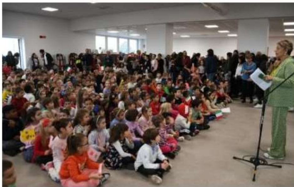
La festa L'inaugurazione dell'ampliamento con i bambini delle elementari

L'intera scuola può accogliere 500 studenti, suddivisi in 20 classi. Il costo complessivo della nuova Pellico è stato di 9 milioni di euro, importo che comprende l'acquisizione di 11mila metri quadrati di terreno circostante. «Si conclude un viaggio iniziato nel novembre 2016, quando il governo di allora concesse di sbloccare l'avanzo del bilancio comunale per le opere pubbliche», ha ricordato il sindaco Gianfranco Dalla Valentina. Fin dal principio fu una corsa contro il tempo.