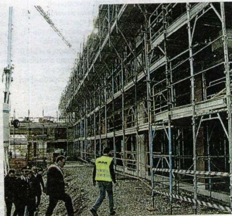
La delegazione in visita al cantiere della scuola

Difficoltà anche di tipo economico, visto che a causa dell'aumento del costo dei materiali il quadro dei prezzi complessivo del secondo stralcio è lievitato a 4,8 milioni di euro (quasi 700mila euro in più rispetto a quanto preventivato). Per far fronte a questo imprevisto dettato dall'impennata dei costi a livello mondiale, la somma è stata attinta interamente dal bilancio comunale come i tre milioni e 700mila euro del primo stralcio. Per questo Flavio Tosi, neodeputato di Forza Italia che ha partecipato alla cerimonia assieme al consigliere regionale Filippo Rigo (Lega), ha assicurato la disponibilità ad aiutare que-