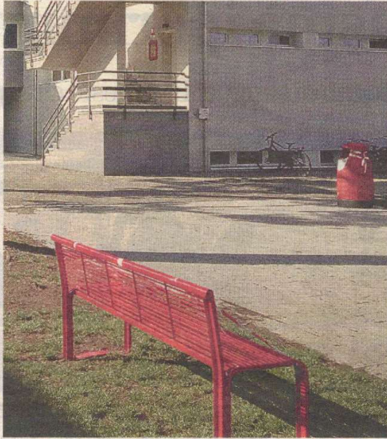
La panchina rossa inaugurata a Lugagnano

Nel cortile delle medie di Lugagnano c'è una panchina rossa in memoria di Ilenia Fabbri e di tutte le vittime del femminicidio. È stata inaugurata venerdì dalle classi terze, nell'ambito del piano del ministero dell'Istruzione sull'educazione al rispetto di genere.